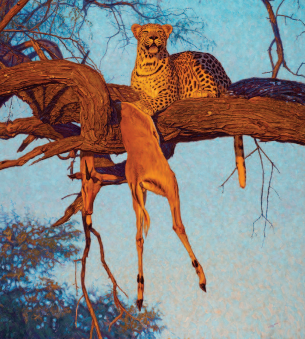
Sikeres vadászat volt (Red Dawn)

vad tájakra (landscape) utal, ahol zavartalanul és egyensúlyban élhet az állatvilág, ahogyan az a „civilizáció” megjelenése előtt történhetett. Fontos megőrizni az elkövetkező nemzedékek számára Földünket és annak flóráját, faunáját. Ezeknek a védett, háborítatlan helyeknek speciális feladatuk van, fel-emelik elménket, elgondolkodtatnak, érzelmileg feltöltenek, és megújítják élni akarásunkat!