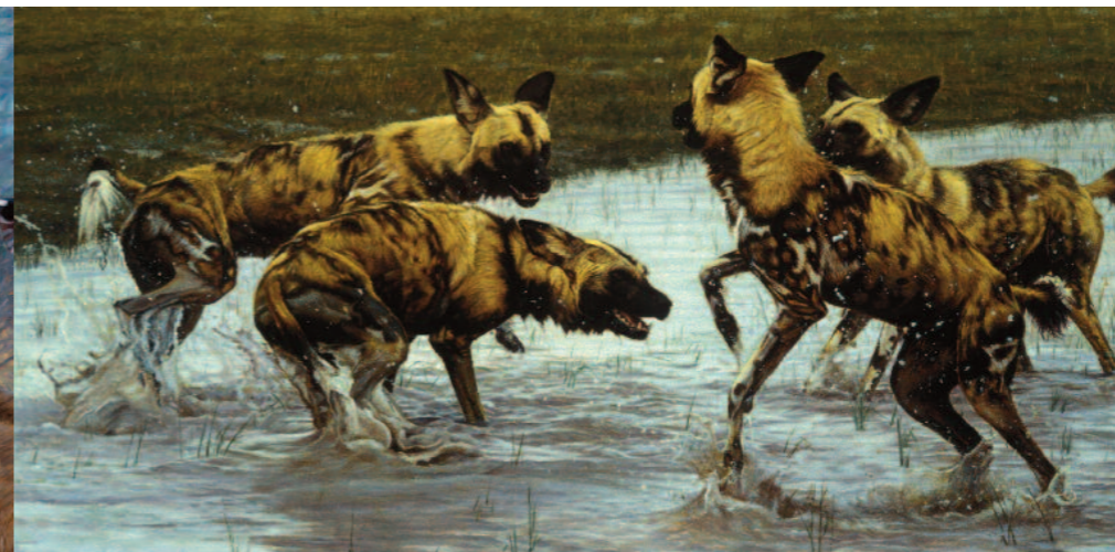
Végre megjött az eső! (After the Rains)

illetően, ebben pedig mi, művészek éppen alkotásainkon keresztül tehetjük a legtöbbet. Nagyon bízom benne, hogy alkotásaim az élővilág behatóbb megismerésére inspirálják az embereket, arra, hogy megmozduljanak egyének és csoportok, erőiket egyesítve sieszenek a természet védelmére, amíg ez még megtehető. Természeti világunkat komoly veszély fenyegeti, ennek érdekében össze kell fogniuk a művészeknek, környezetvédőknek, természetvédőknek, sportvadászoknak és a médiának a minél nagyobb befolyás elérésére.”