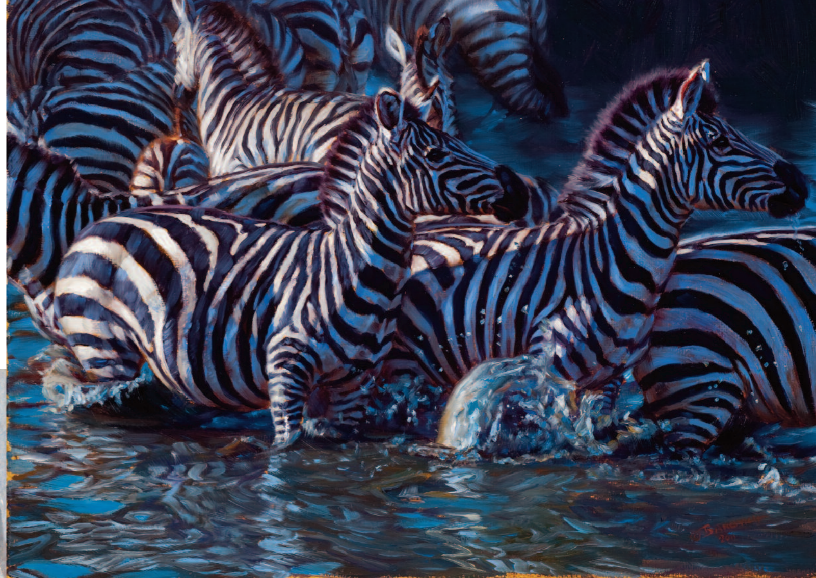
Bíbor folyó (Dark Water)