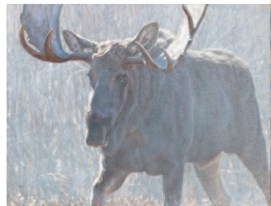
A legbikább jávor (Bull of the Woods)

Alapítványának 7 országban 12 projektje van, ezek révén főleg Afrikában (de Ázsiában és Amerikában is) aktívan segítik a természetvédelem ügyét. A legtöbb munkát a P.R.I.D.E. – oroszán projekt adja, de támogatják a hegyi nyala, az erősen veszélyeztetett gepárd és hegyi gorilla védelmét is. Ugyancsak részt vesznek az amuri tigris fennmaradásáért folytatott küzdelemben, és sokat tesznek a grizzlypopuláció védelméért is.