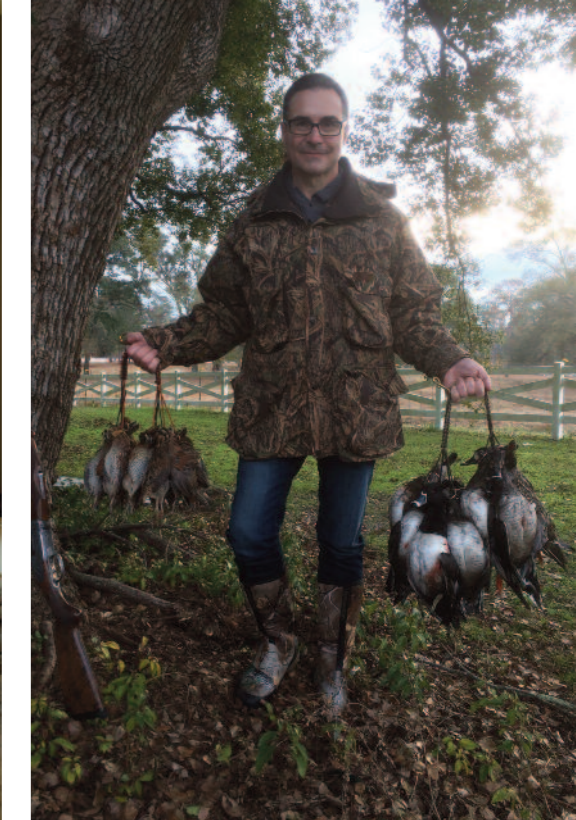
Szükség volt mindkét aggatékra

John művész és természetvédő, aki alkotásaival hívja fel a figyelmet az ökológiai kihívásokra, ennek érdekében sokat utazik. „Bejárom a Földet téma után kutatva, de legszívesebben Afrikába térek vissza minden évben, ahol még most is a pleisztocén korra emlékeztető hatalmas állatok élnek, nagy fokkal.” (J. B.)