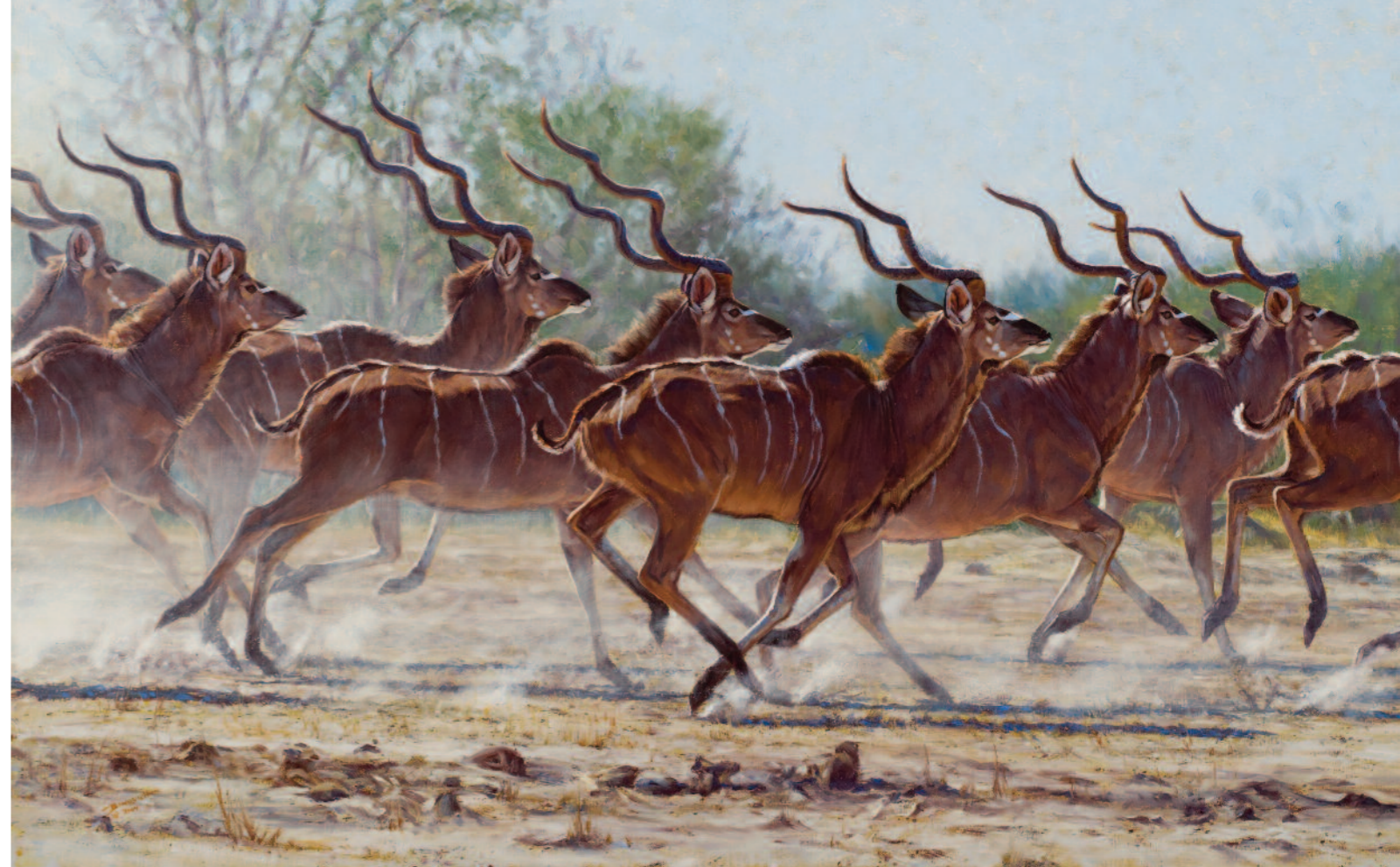
Férficsapat (Bachelor Herd)

„Most sokkal hatékonyabban, mint eddig bármikor, el kell juttatnunk üzenetünket az emberekhez a természet fokozott védelméért