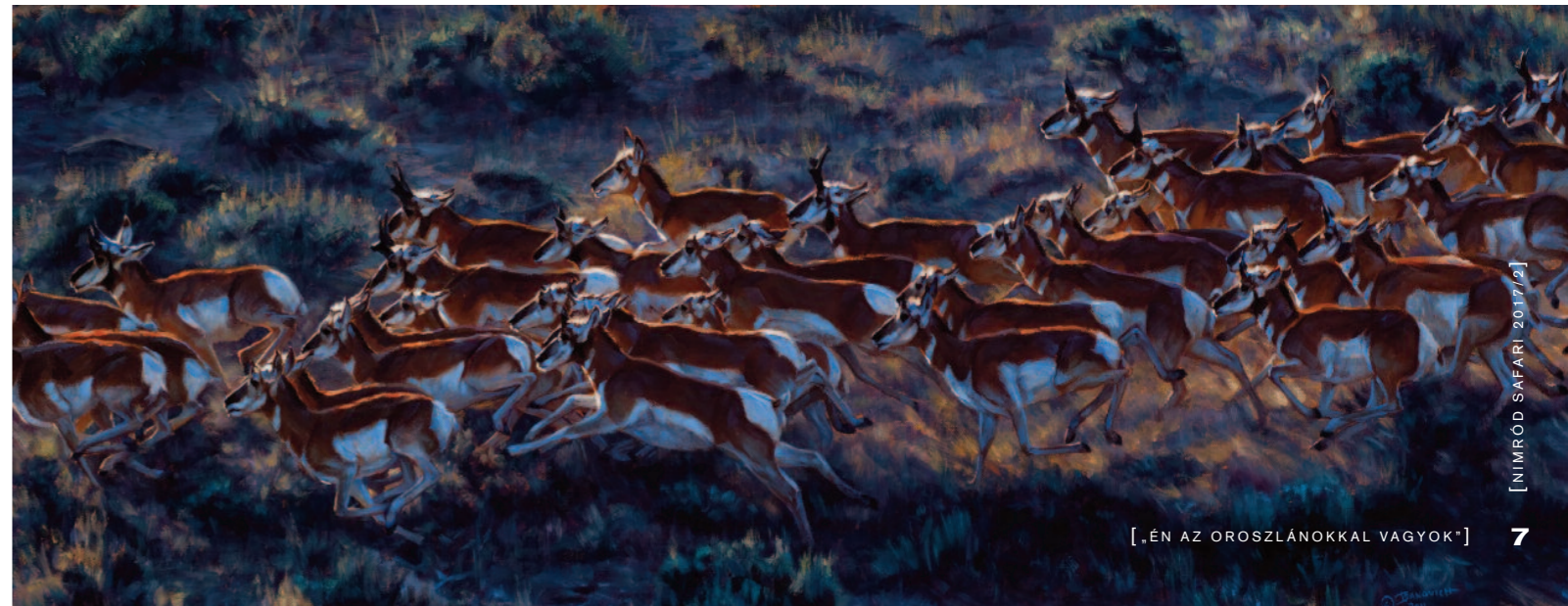
Sebességre kapcsolva (Sixty Miles Per Hour)

„Nagyon sokat kaptam a természettől, indíttatást éreztem ennek ”visszafizetésére”, ezért hoztam létre a Banovich Wildscape Alapítványt.” (J. B.) Maga a WILDSCAPE szó a hatalmas területekre, nagy kiterjedésű