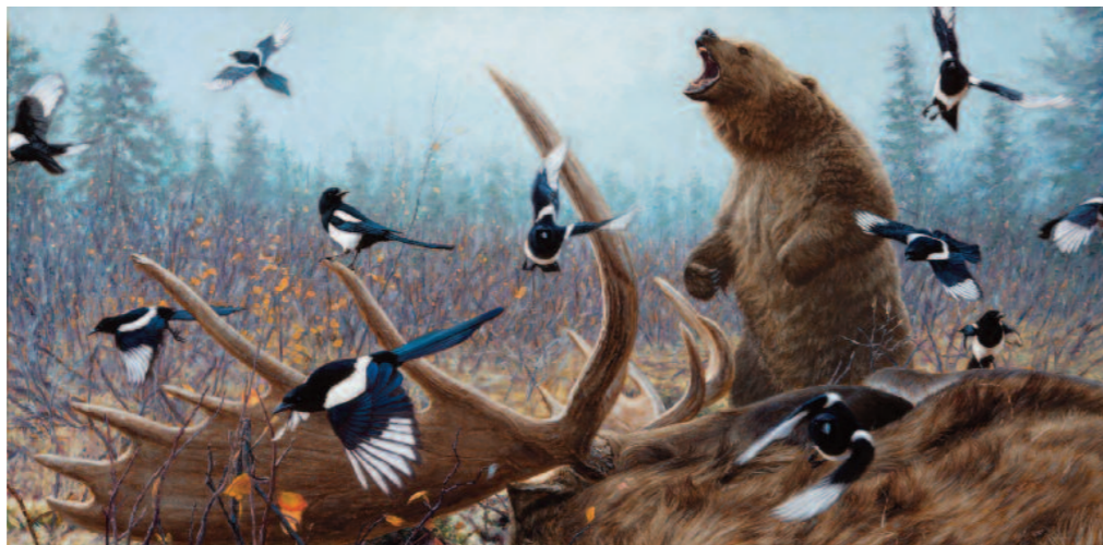
Itt minden az enyém! (Grizzly Encounter)

Az utóbbi esetben a nevelés, meggyőzés és természetesen az anyagi motiváció segíthet. A pénz és az alapítvány anyagi támogatása is számtalan helyen hasznosítható, hiszen a fentiekén kívül ebből kártalanítják a háziállatát elvesztett parasztot, ebből építenek iskolákat, kórházat, és építik ki a megfelelő infrastruktúrát.