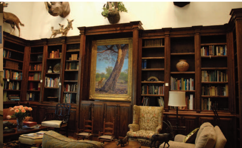
Leopárd a szekrényben (Leopard Call)