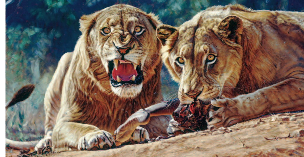
Embrevők (Maneaters of Tsavo)

A természetben járva mindig magával viszi fényképezőgépet, amellyel számtalan felvételt készítve igyekszik az állatok legjellemzőbb helyzetét, testtartását megörökíteni, aminek alapján elkészítheti vázlatait. Fontos munkaeszköz, de csupán a főszereplőt (és a részleteket) mutatja, nem „adja annak a lelkét”. Ezt csak az alapos, néha több órán át tartó megfigyeléssel tudja megérteni. Az élmények felelevenítése és a fotó tanulmányozása után kezdődhet az alkotás,