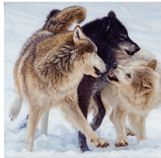
A farkavezér kényeztetése (Alpha)