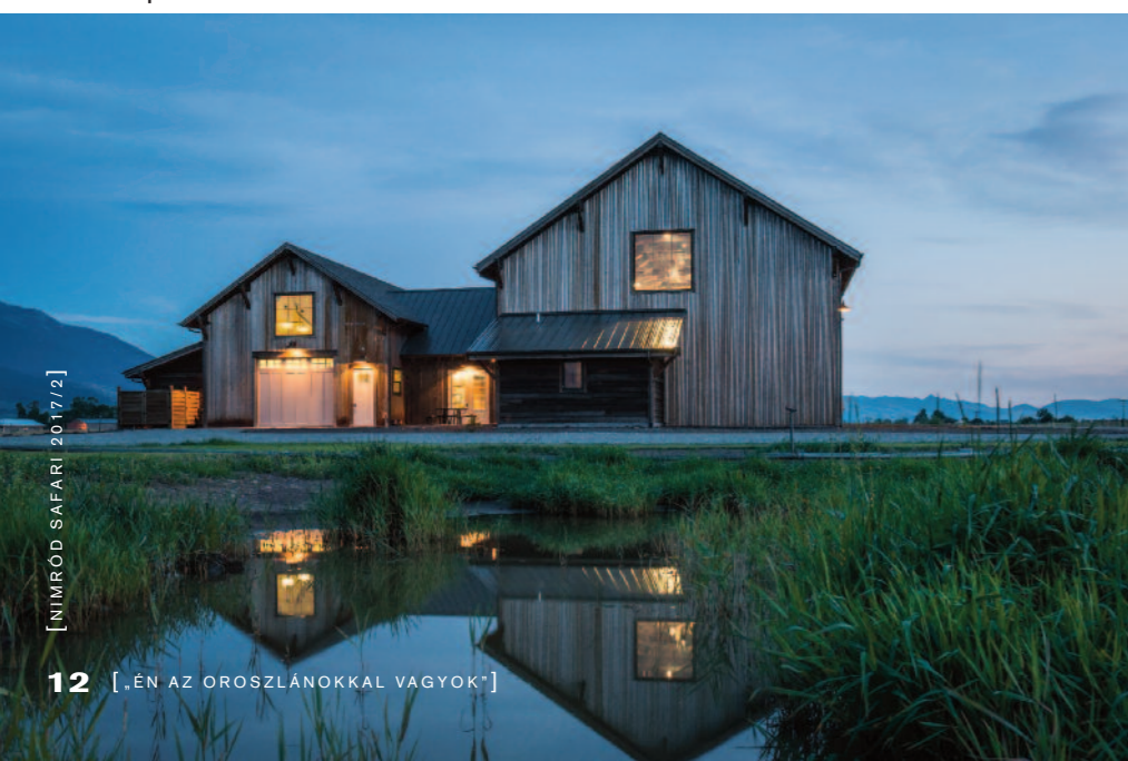
A tóparti Banovich ház

Jelenleg egy nagy kiállításra készül, amelynek anyaga 2019-re készül el: „Az állatok királya – tanulmányok az afrikai oroszlánról” (King of Beasts). Az egyedülálló kiállítást a nevadai Művészeti Múzeumban mutatják be, 2020-ban amerikai körútra indul, és feltehetőleg külföldre is eljut majd. A 30 festmény bemutatja azt az állatot, amelyet minden kor minden kultúrája tisztelt, a nemeség, erő, bátorság szimbólumának tartották, több ország választotta címerállatának. Az oroszlánok megjelenését, életfázisait bemutató képek mellett láthatók lesznek vadászatokat ábrázoló alkotások is, természetesen zsákmányállataikkal együtt, így több képen megjelennek kafferbivalyok is. A leendő kiállítással kapcsolatban már eddig is sok cikk jelent meg, a természet védelmét magának tudó publikum már most izgatottan várja az alkotásokat.