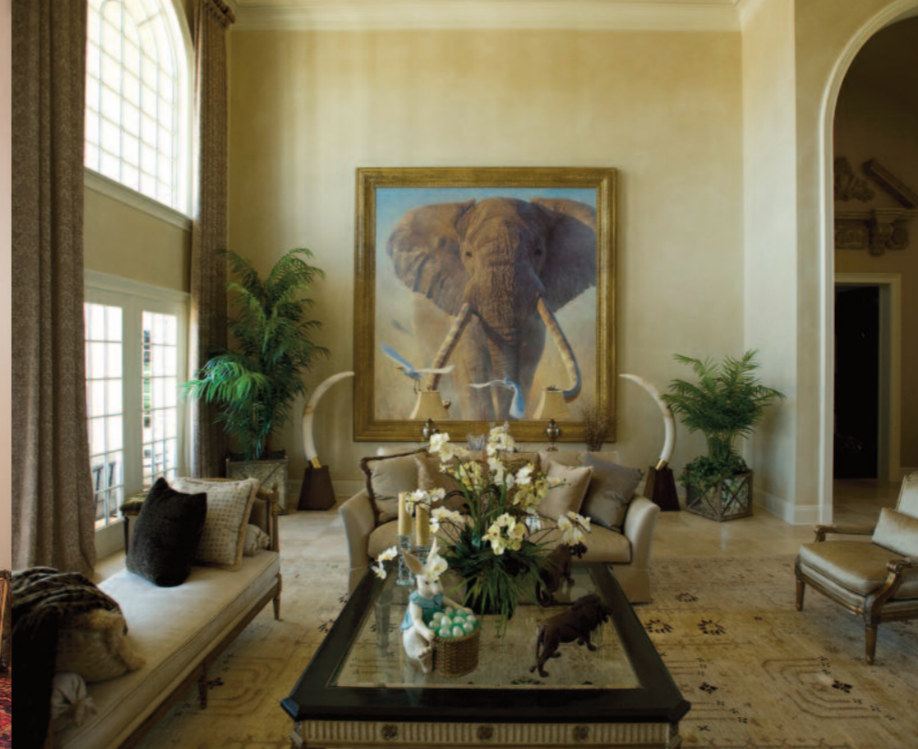
Egy békésebb elefánt (Childress Project)