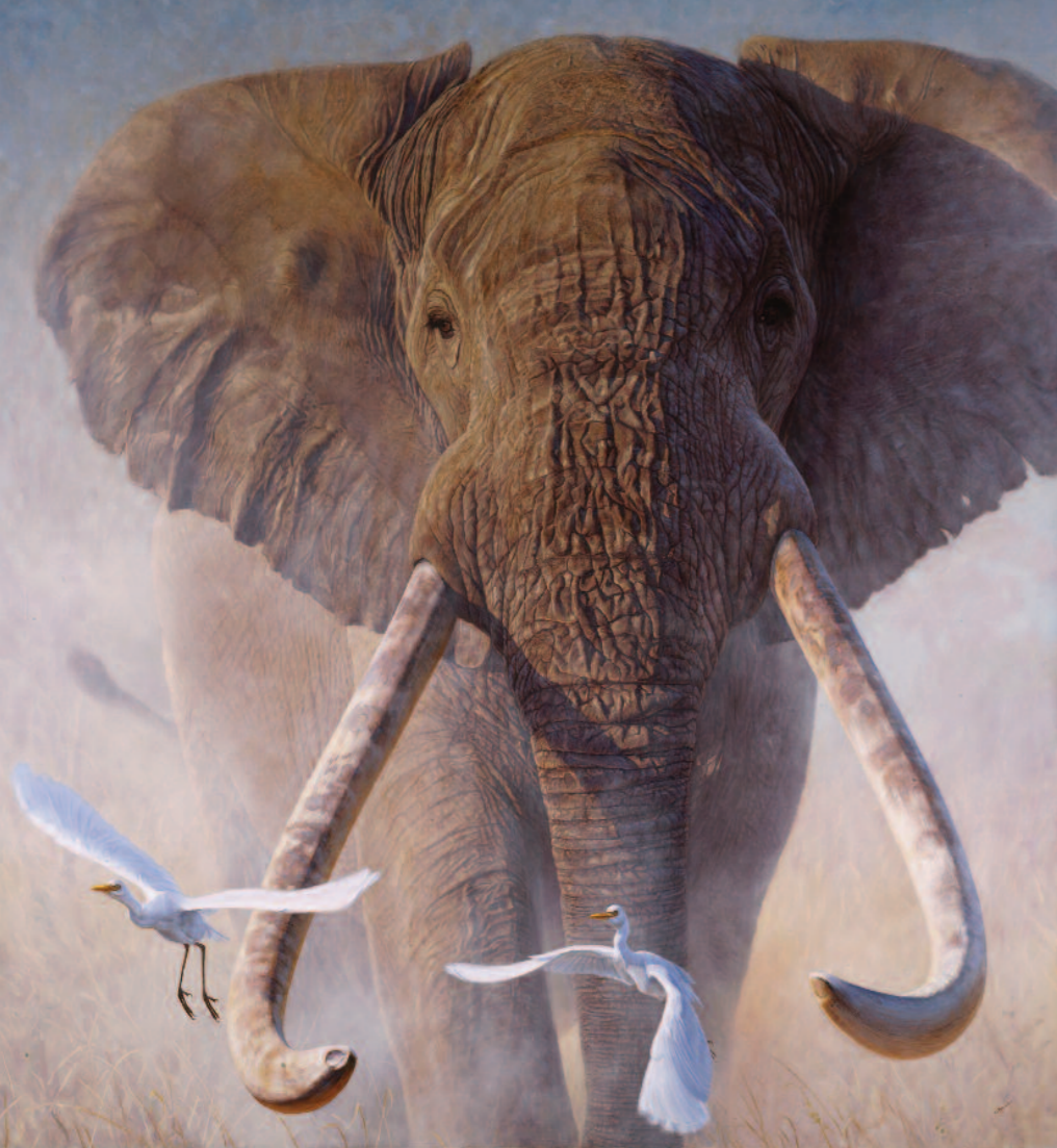
Valamikor tán' ilyen is volt! (Once Upon A Time)